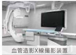
血管造影X線撮影装置

(注目:人工関節センター、生殖医療センター)が整備されます。市内完結率を高めるHCU(高度治療室)SCU(脳卒中治療室)が整備され、手術後の患者や救急で受け入れた患者に、より安全で質の高い治療が提供されます。また、医師や看護師などが救急現場に駆けつけて、初期治療ができるドクターカー(ラピッドレスポンスカー)を導入する事で、救急患者の救命率向上が図られます。公設公営時代に培った公の病院としての使命感はしっかりと引き継ぎつつ、民間病院の経営ノウハウが組み合わされた、市民の生命を守る新しい病院として、今まで以上に質の高い医療が提供される事に期待しています。